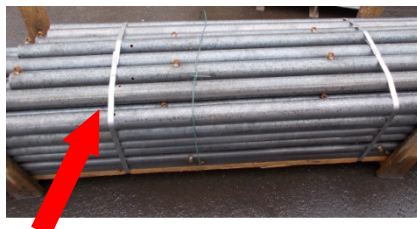
Stahlband + Palette